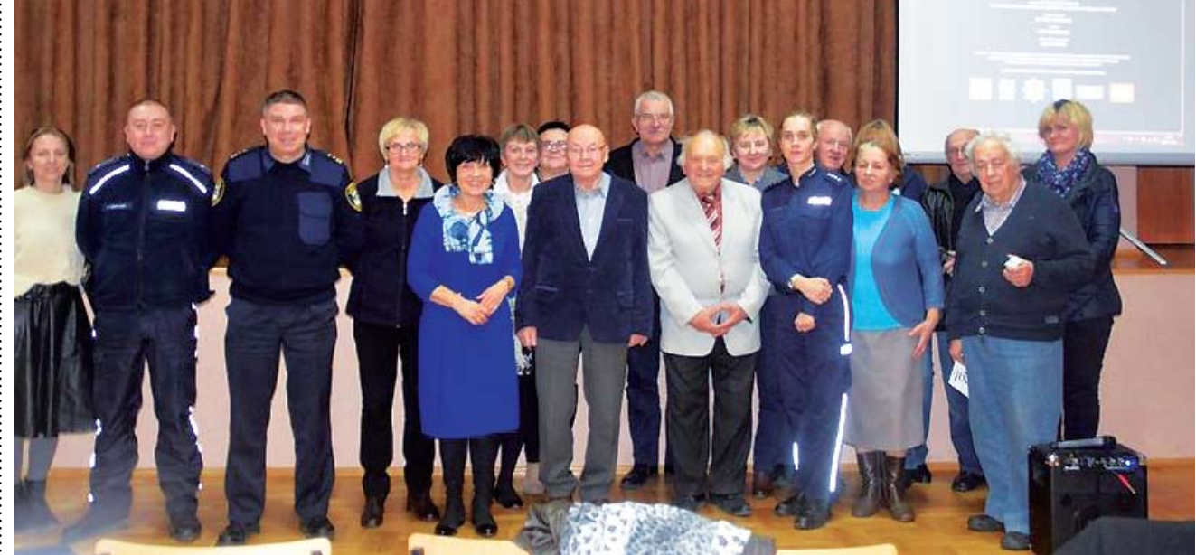
Uczestnicy spotkania w Multimediálním Centrum Kultury e-Eureka - Biblioteka Publiczna w Świeszynie

Ja radzić sobie z oszustami, o przemoc domowej i samotności oraz o bezpieczeństwie w ruchu drogowym dyskutowano w Multimediálním Centrum Kultury e-Eureka - Biblioteka Publiczna w Świeszynie.