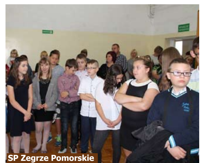
SP Zegrze Pomorskie