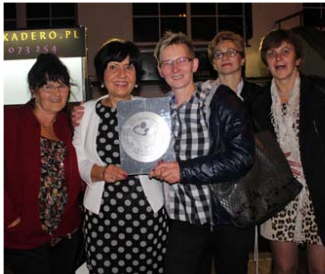
Chórzystki ze Świeszyna ze zdobytą „Platynową Płytą”

Chór „Kamerton 3” ze Świeszyna zwyciężył, w kategorii „profesjonalności”, w konkursie karaoke „Głosy dla Hospicjum”.